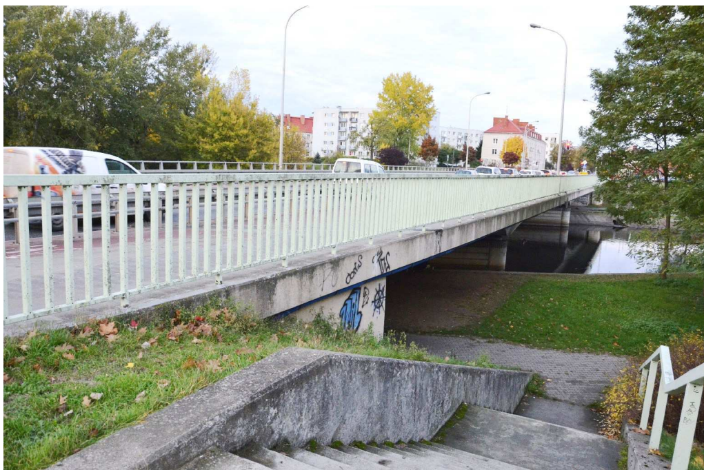
Fot. 1 Widok z boku