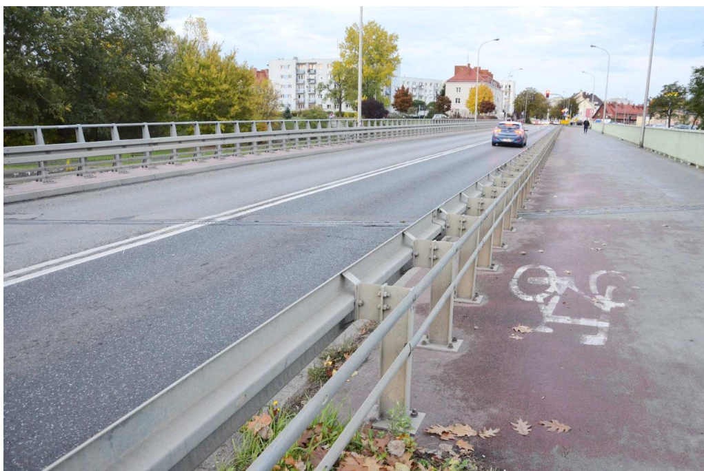
Fot. 2 Widok na jezdnię