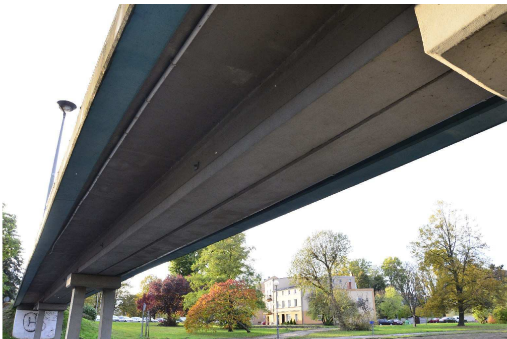
Fot. 3 Widok na spód ustroju nośnego