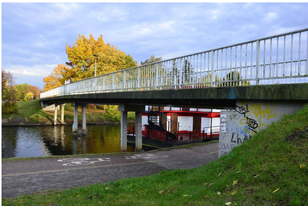
Fot. 1 Widok z boku