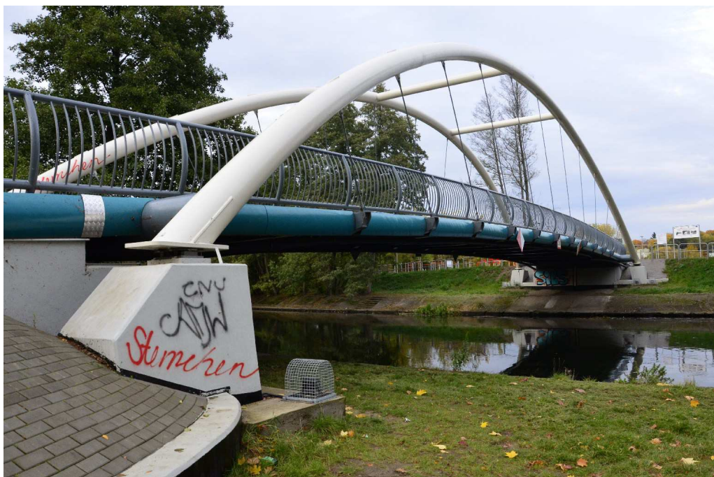
Fot. 1 Widok z boku