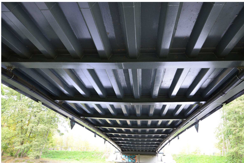
Fot. 3 Widok na spód ustroju nośnego